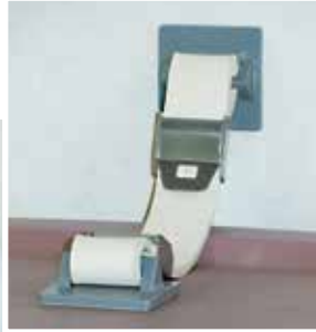
※写真は取付け例です。