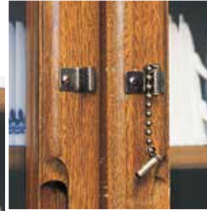
※写真は取付け例です。