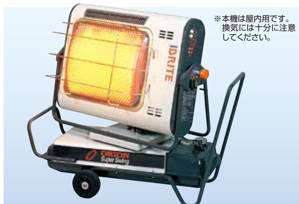
※本機は屋内用です。 換気には十分に注意してください。