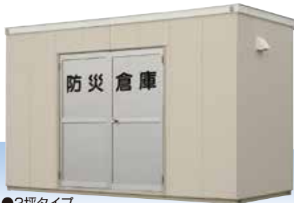
●2坪タイプ ※写真の2坪タイプは特注で別材質の外壁です。