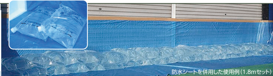
防水シートを併用した使用例(1.8mセット)

水害時、土を用意しにくい都市部などで活躍する水のう。片付けが簡単で、破れにくい高強度極厚素材なので複数回使用できます。セットの土のう袋に入れば設置しやすくなり、さらに防水シートや止水クッションを併用すれば効果が高まります。 材質/ナイロン ポリエチレン 商品サイズ/350×500mm(1枚) 容量/約10L