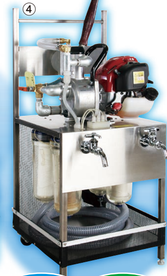
④ エンジンポンプ + 手動ポンプ