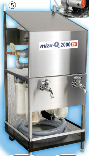
⑤ モーターポンプ + 手動ポンプ

①災害用浄水器〈mizu-Q500〉 4380 浄水ポンプと12ℓタンクを背負子にセットした持ち運びの楽な浄水器。プールの水や雨水などをろ過して、いざという時、迅速に浄水することができます。電源不要で操作も簡単、どなたでも使いこなすことができます。 ¥106,480 (本体価格 ¥96,800 )