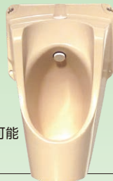
小便器本体は スタッキング可能