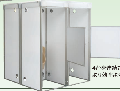
4台を連結させて、 より効率よく。