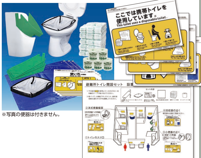
※写真の便器は付きません。