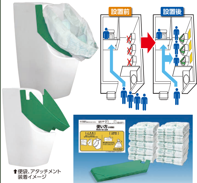
↑便袋、アタッチメント装着イメージ